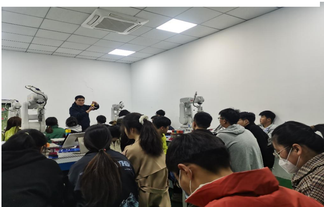
图8 智能工程技术学院教师授课现场

为了提高学院教育教学质量，提升新教师的课堂教学水平，强化课堂实效意识，加强教师队伍建设，3月20日下午，智能工程技术学院开展第6周推门听课督学听课工作。