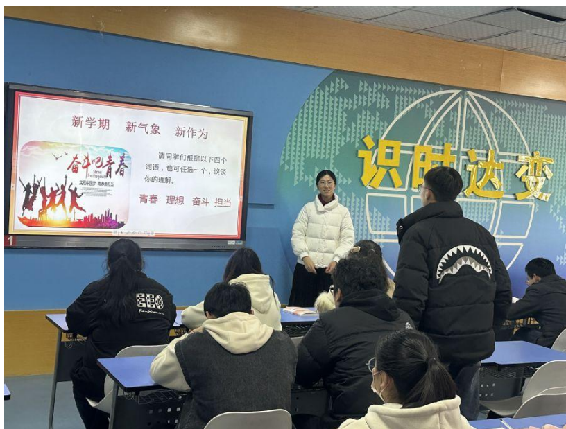
图5 “开学第一课”活动现场

在《思想道德与法治》课的课堂上，任课教师将青春、理想等元素融入其中，引导学生坚持将个人理想与社会理想有机结合，立大志、明大德、成大才、担大任，为实现中国梦注入青春能量。