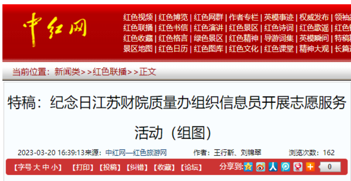
图 2 中红网报道截图

本次志愿活动为期一天。在纪念日游园阶段，学生信息员被分配到核心区、红星广场、游客接待中心、纪念林、停车场等预定地点，配合陵园管理人员做好文明引导和秩序维护等志愿服务：在纪念馆耐心解释闭馆缘由和正常开馆时间安排、在停车场引导社会车辆有序排放、在主题战壕引导父母监护好孩子防止碰伤、在游客接待中心帮助走失儿童寻找父母和归还游客遗失的身份证钱包等物品，在纪念林引导游客不攀爬河塘护栏，在中心路引导游客保证人车分离。