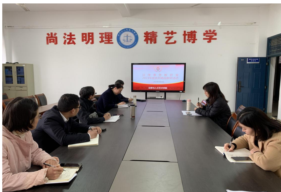
图 6 法律与人文艺术学院教研活动现场

普遍存在的情况，法律教研室在教研活动中，组织教师进行讨论，从课堂纪律入手，促进提高课堂实效。针对课堂纪律和课堂实效的促进提升，各专业组织专门的研讨活动，从教师上课的仪态、站位以及课堂活动的组织、翻转课堂的实施等不同角度提出了自己的看法，最终得出的一致意见是，教学中，可以通过案例分析研讨、小组讨论、小组代表分享等活动，提高学生参与课堂活动的积极性，从学生主观积极性促进课堂实效；同时，教师在上课时，要严抓考勤，将考勤作为平时成绩的重要依据，提高出勤率，同时，教学过程中，要走下讲台，走到学生中间，才能客观上促进学生参与课堂，提高实效。