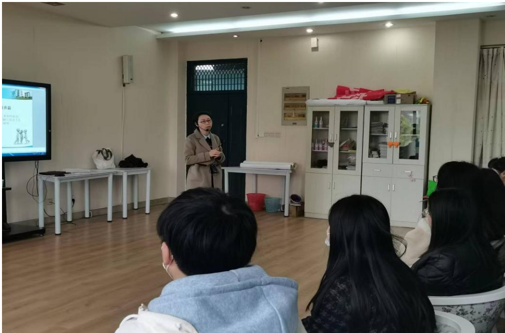
图4 专项督导教师授课现场

新学期开始后，质量办为实现督导全覆盖，根据年度工作安排的“重点督”、“常态督”和“专项督”思路，对马克思主义学院、兼职教师和外聘教师先行开展三个专项督导工作。