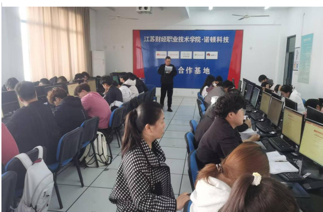
图 8 智能工程技术学院督导组听课现场图

督导组成员们在听课过程中，认真记录着教师的教学内容、教学方法和学生的学习情况。他们关注着教师的授课是否清晰、准确，教学方法是否得当，学生的参与度是否高，课堂氛围是否活跃等方面。同时，他们也在思考着如何为教师提供更好的教学建议，以促进教学质量的进一步提高。