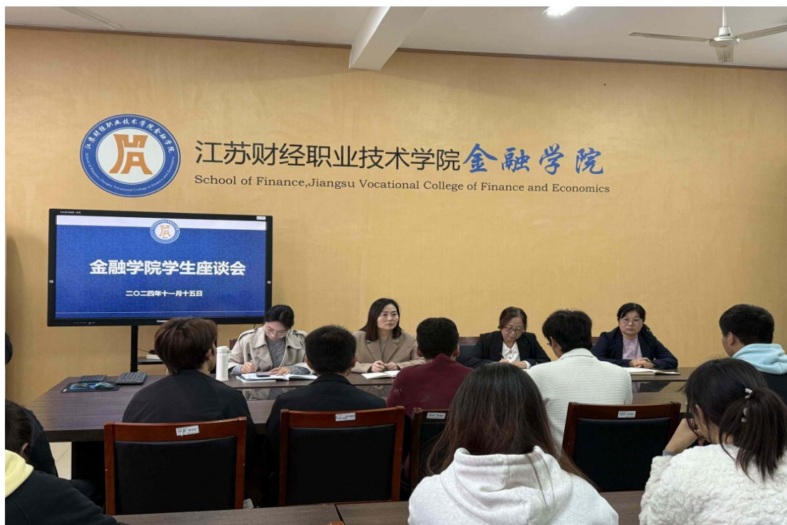
图6 金融学院学生座谈会现场图

本次座谈会旨在更好的倾听学生心声，搭建了金融学院和学生融合交流的平台，促进了和学生的进一步沟通。同时，也鼓励学委们继续发挥桥梁作用，积极与学院沟通，共同推动学院的学风建设和教学质量提升。（供稿：张沁媛，审核：朱江）