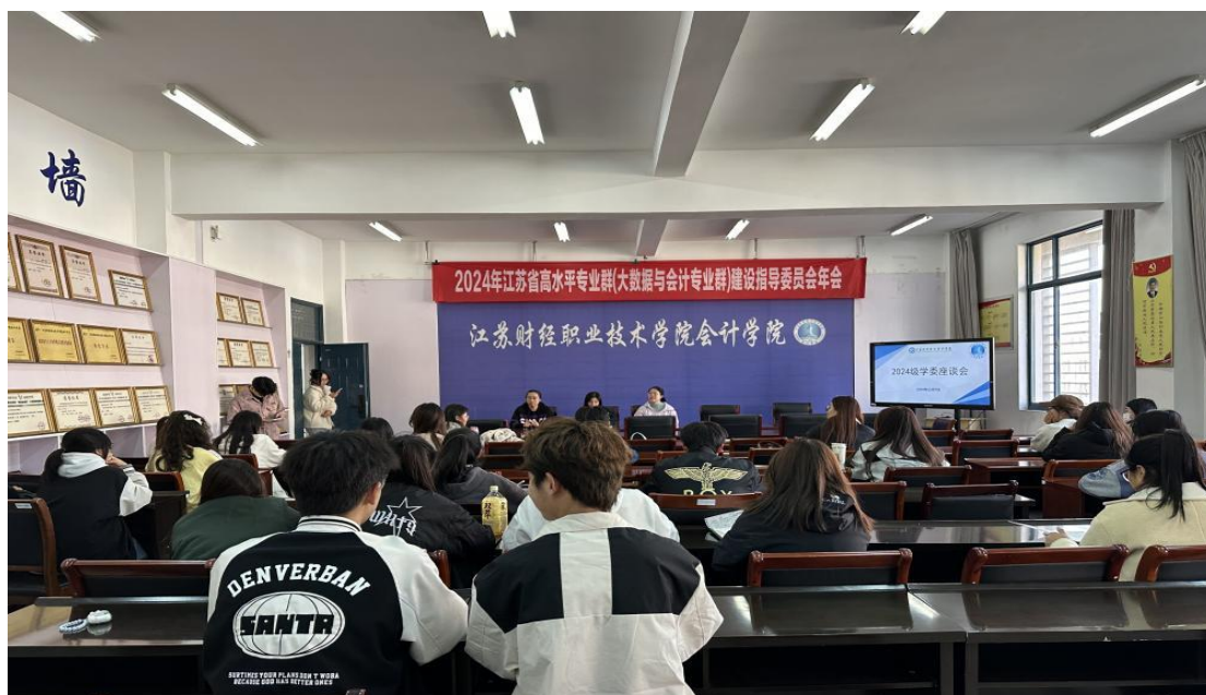
图 7 会计学院学委座谈会现场图

容、教学方法、课堂氛围等方面的情况，并积极传达了学生的诉求。与会老师认真听取了学委们的发言，并详细记录了他们的意见和建议。他们表示，将把学委们反映的问题和诉求及时反馈给相关部门和教师，并尽快采取措施加以解决。同时，他们也鼓励学委们继续发挥桥梁作用，积极与学院沟通，共同推动会计学院的学风建设和教学质量提升。